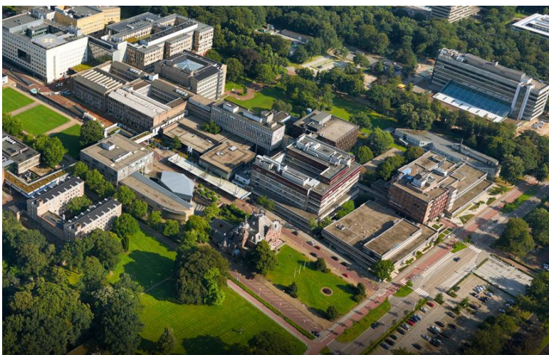
Op de afbeelding is rechtsboven het vernieuwde gebouw Tandheelkunde te zien.

Alle gebouwen tussen het nieuwe hoofdgebouw en de Philips van Leijdenlaan worden gesloopt. Op de universiteit bestaat de ambitie om het autogebruik terug te dringen. Mogelijk wordt het terrein weer parkachtig, zoals toen het nog een landgoed was. De afgelopen tijd is een begin gemaakt met de sloop van gebouwen aan de Philips van Leijdenlaan te beginnen met de naast Tandheelkunde gelegen gebouwen voor Dermatologie. Inmiddels bevindt zich naast Tandheelkunde al een groot braakliggend terrein, zoals op onderstaande foto is te zien.