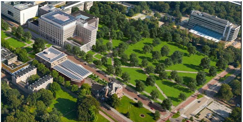
Arts impression met linksboven het vernieuwde hoofdgebouw van het Radboudumc en rechtsboven Tandheelkunde