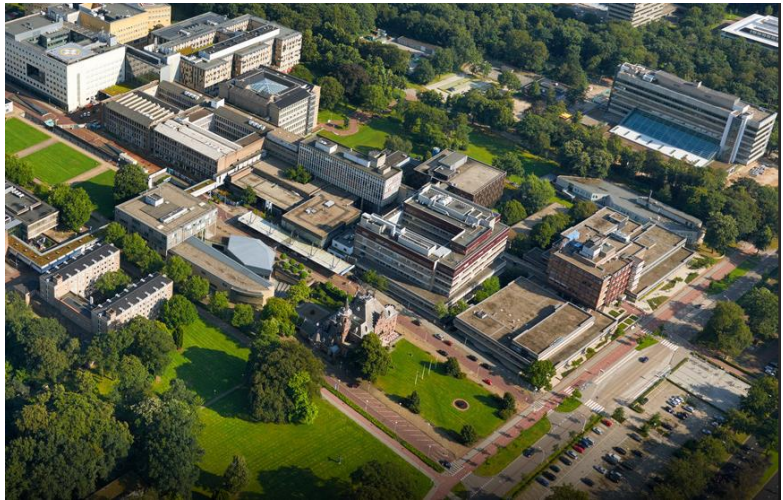
Op de afbeelding is rechtsboven het vernieuwde gebouw Tandheelkunde te zien.

Alle gebouwen tussen het nieuwe hoofdgebouw en de Philips van Leijdenlaan worden gesloopt. Op de universiteit bestaat de ambitie om het autogebruik terug te dringen. Mogelijk wordt het terrein weer parkachtig, zoals toen het nog een landgoed was. De afgelopen tijd is een begin gemaakt met de sloop van gebouwen aan de Philips van Leijdenlaan te beginnen met de naast Tandheelkunde gelegen gebouwen voor Dermatologie. Inmiddels bevindt zich naast Tandheelkunde al een groot braakliggend terrein, zoals op onderstaande foto is te zien.